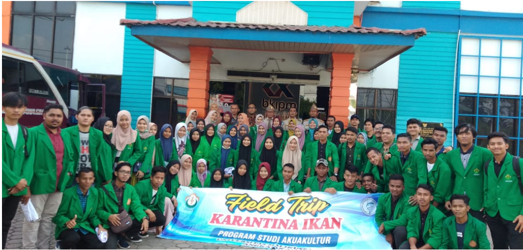
Mahasiswa Program Studi Akuakultur Fakultas Pertanian Universitas Malikussaleh mengunjungi Stasiun Karantina Ikan, Pengendalian Mutu dan Keamanan Hasil Perikanan (SKIPM) Medan II.