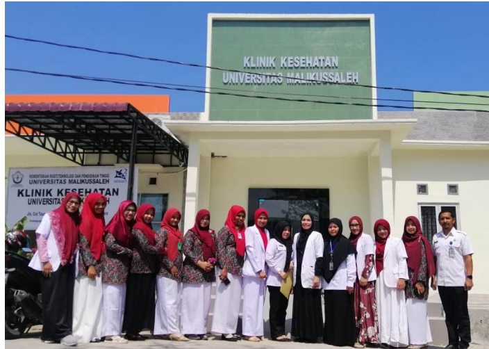
Badan Narkotika Nasional (BNN) Kota Lhokseumawe mengunjungi Klinik Kesehatan Universitas Malikussaleh di Kampus Releut, Kecamatan Muara Batu, Aceh Utara, Kamis (16/1).