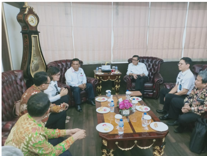
Tim dari beberapa Universitas di Indonesia beraudiensi dengan Menteri Hukum dan Ham, Yasonna Laoly di Kantor Kemenkumham Jakarta, Rabu (12/2/2020)