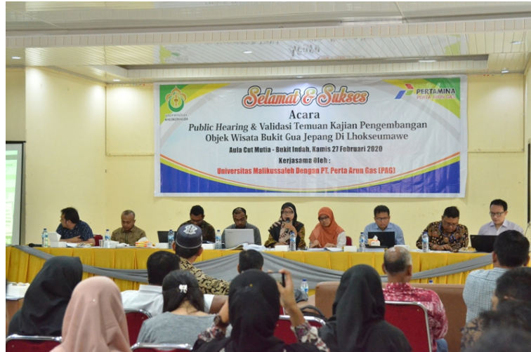
Akademisi Universitas Malikussaleh mengadakan Public Hearing dan Validasi Temuan Kajian Pengembangan Objek Wisata Bukit Gua Jepang di Aula cut Meutia, kampus bukit indah, Lhokseumawe, Kamis (27/2).