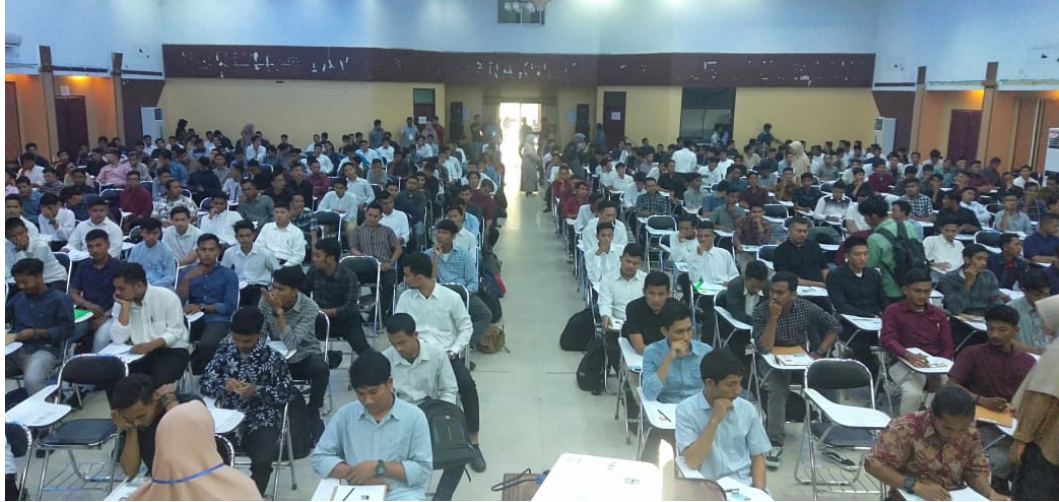
Peserta Tes Potensi Akademik (TPA) calon Operator Development Program (ODP) Pabrik NPK Pupuk Iskandar Muda di GOR Uteungkot Unimal, Lhokseumawe.