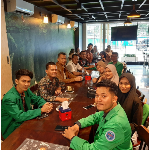
Rektor Universitas Malikussaleh bersama Mahasiswa peserta PMMB daerah penempatan Jakarta, Minggu (8/3/2020).