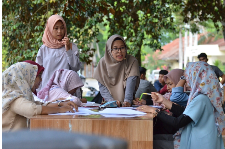
Sejumlah Mahasiswi Unimal sedang berdiskusi di Taman Kampus Bukit Indah, Lhokseumawe.